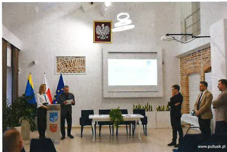
Fot. 3. Uczestnicy spotkania konsultacyjnego w dn. 29 stycznia 2024 r.

Odwołując się do sugestii, pytań, a także wątpliwości podnoszonych przez uczestników spotkania, eksperci firmy Projekty Miejskie szczegółowo opisywali metodologię prac nad wyznaczeniem obszaru zdegradowanego i obszaru rewitalizacji i zachęcali mieszkańców do zaangażowania w wydarzenia konsultacyjne planowane na okres po planowanym przyjęciu przez Radę Miejską w Pułtusk uchwwały o przystąpieniu do prac nad Gminnym Programem Rewitalizacji.