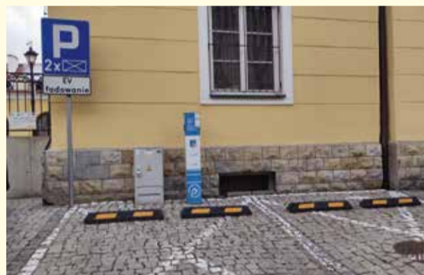
Jedna z dwóch stacji ładowania pojazdów elektrycznych