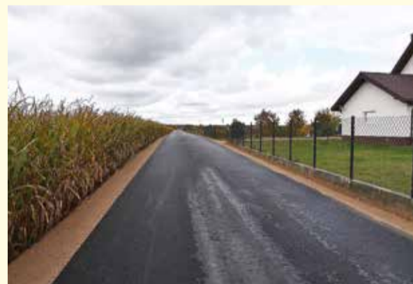
Zmodernizowana droga w Kokoszce