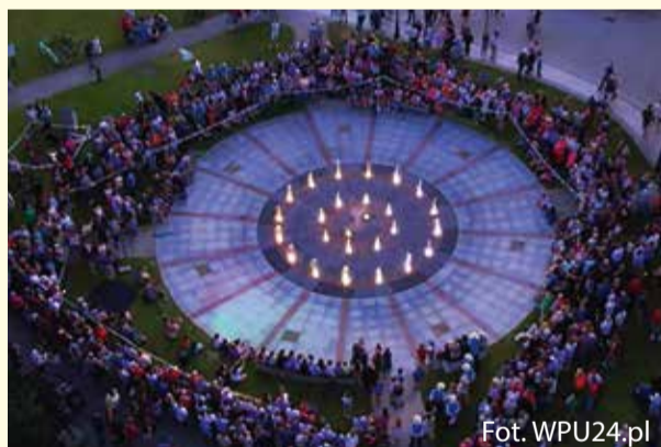
Uruchomienie multimedialnej fontanny