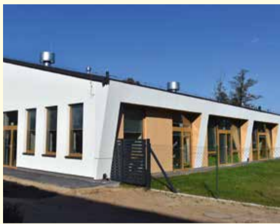
Przedszkole Wiejskie w Przemiarowie