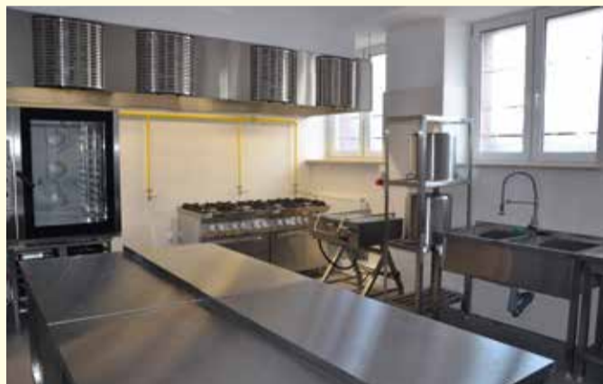
Nowoczesna kuchnia w PSP nr 3 w Pułtusk