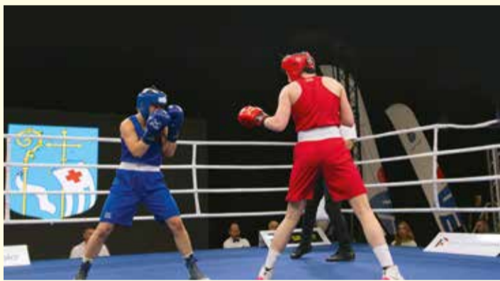
Międzynarodowy Turniej Bokserski im. Feliksa Stamma w Pułtusku