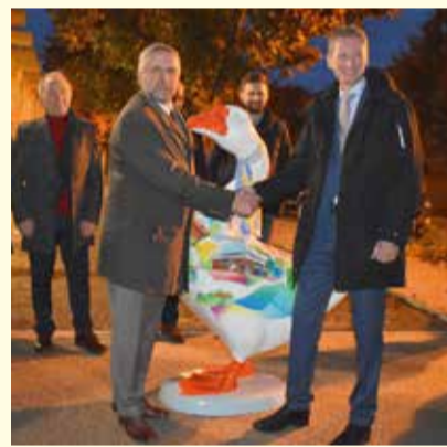
Burmistrzowie Pułtuska i Ganderkesee podczas powitania figury Gantera