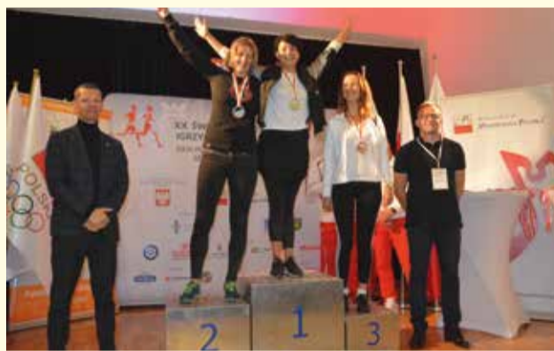
XX Światowe Letnie Igrzyska Polonijne