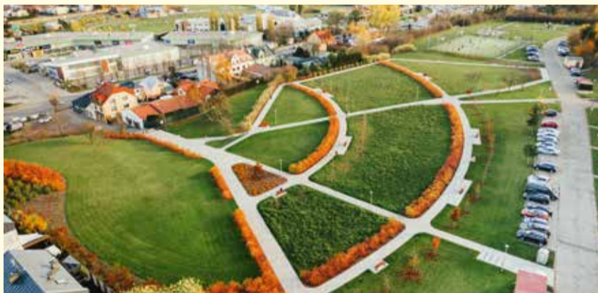
Park przy ulicy Widok