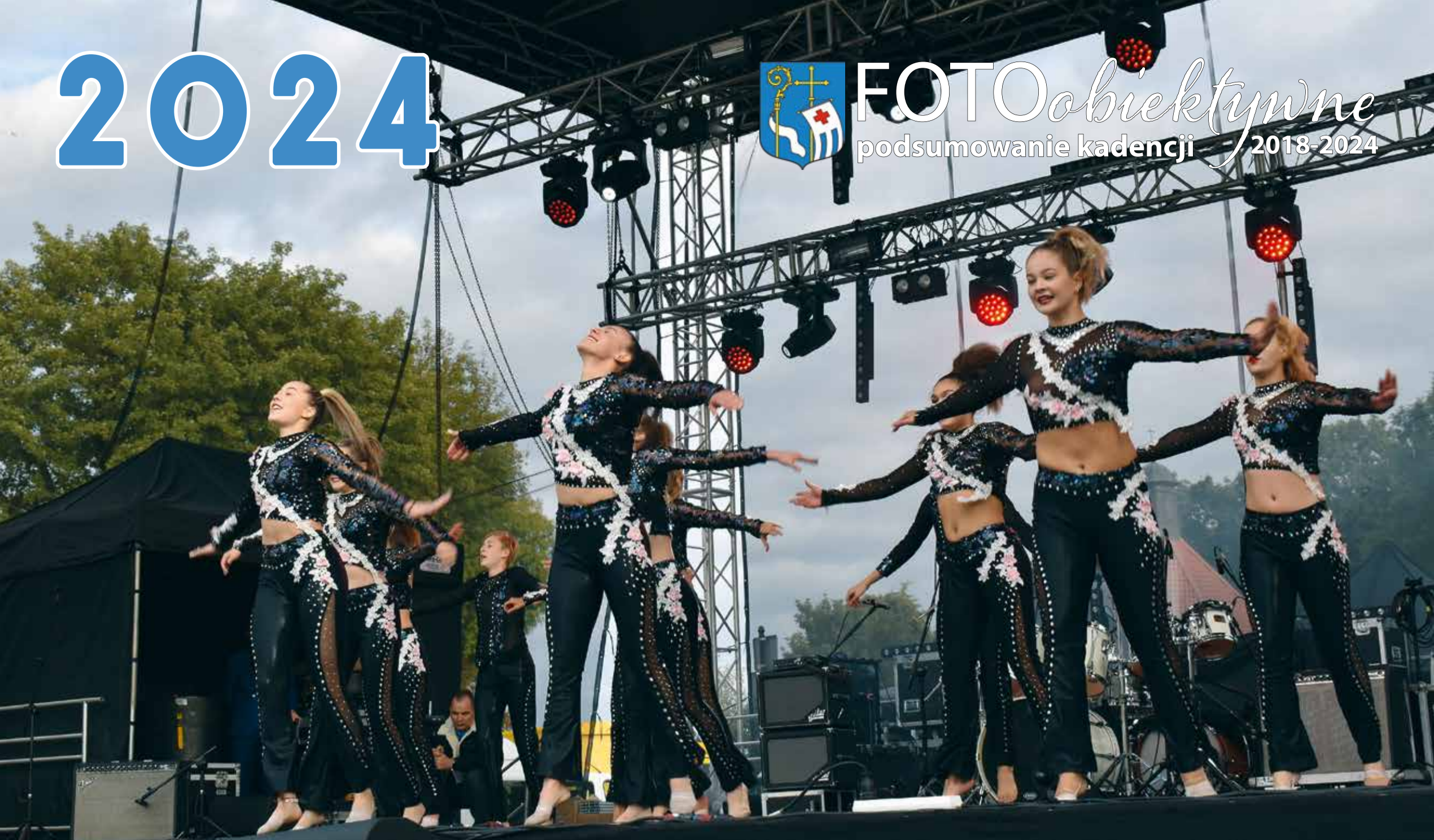
Prezentacja miasta partnerskiego Senica podczas Dni Patrona Pułtuska

FOTOObiektywne podsumowanie kadencji 2018-2024