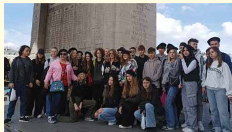
Wizyta uczniów z Pułtuską we Francji, w ramach współpracy z miastem Montmorency