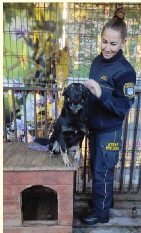
Miejsce przetrzymywania wylapanych zwierząt przed odwiezieniem ich do schroniska