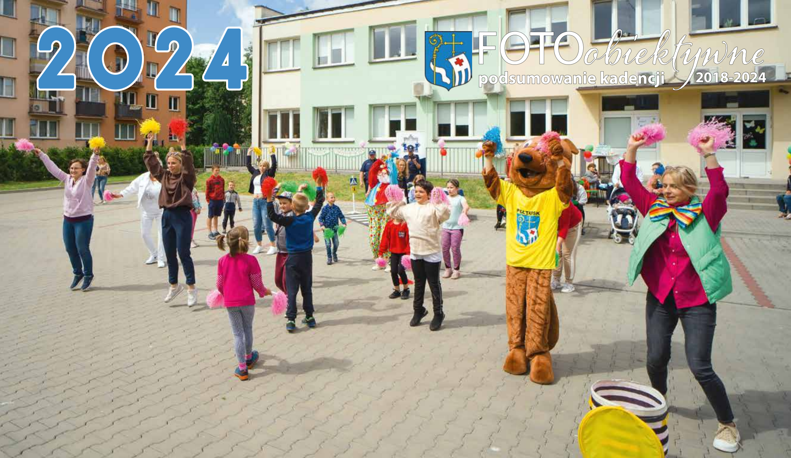
Piknik z okazji Dnia Dziecka zorganizowany przez MOPS

FOTOobiektywne podsumowanie kadencji 2018-2024