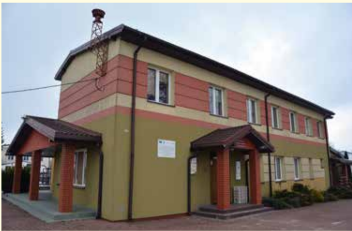
Świetlica Wiejska w Przemiarowie z utworzonymi mieszkaniami na potrzeby kryzysowe