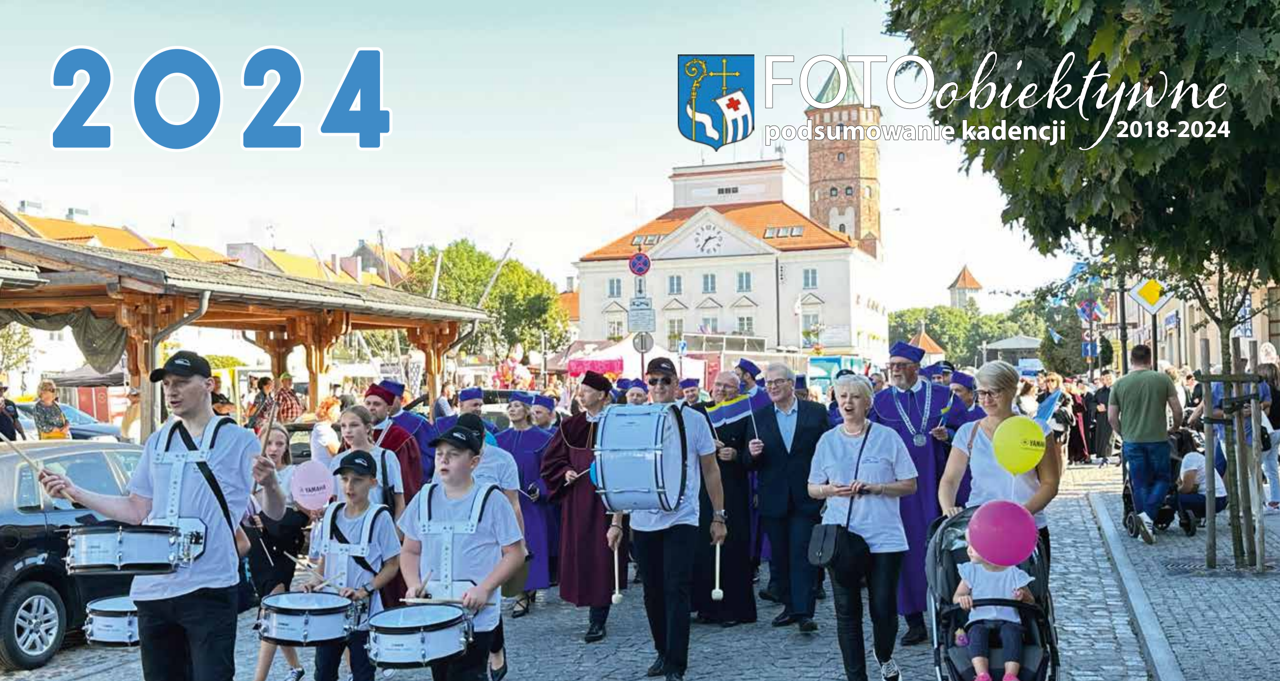
Barwny Korowód ulicami miasta w ramach Dni Patrona Pułtuska

FOTOobiektywne podsumowanie kadencji 2018-2024