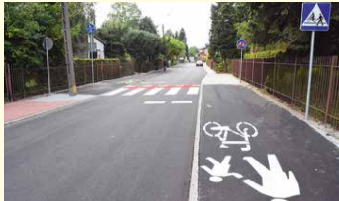
Zmodernizowana ulica Baltazara