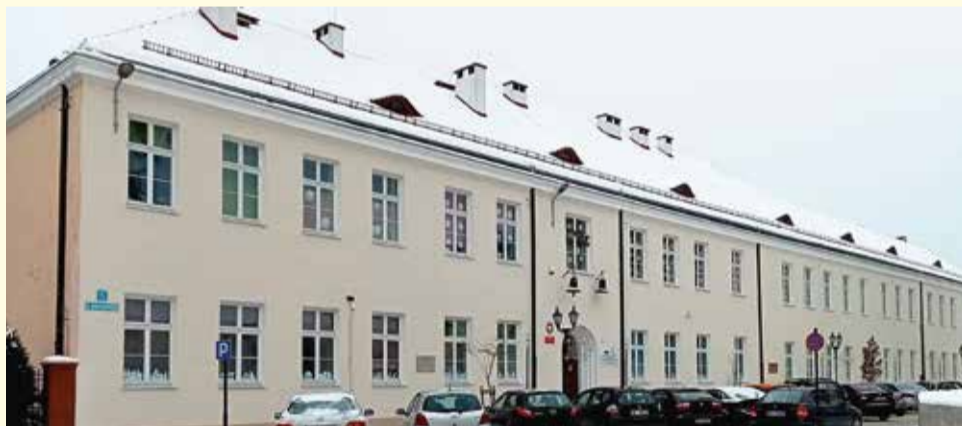
Wyremontowana elewacja PSP nr 1