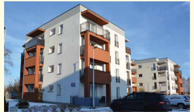
Oddany do użytkowania blok przy ul. Jana Pawła II 19A