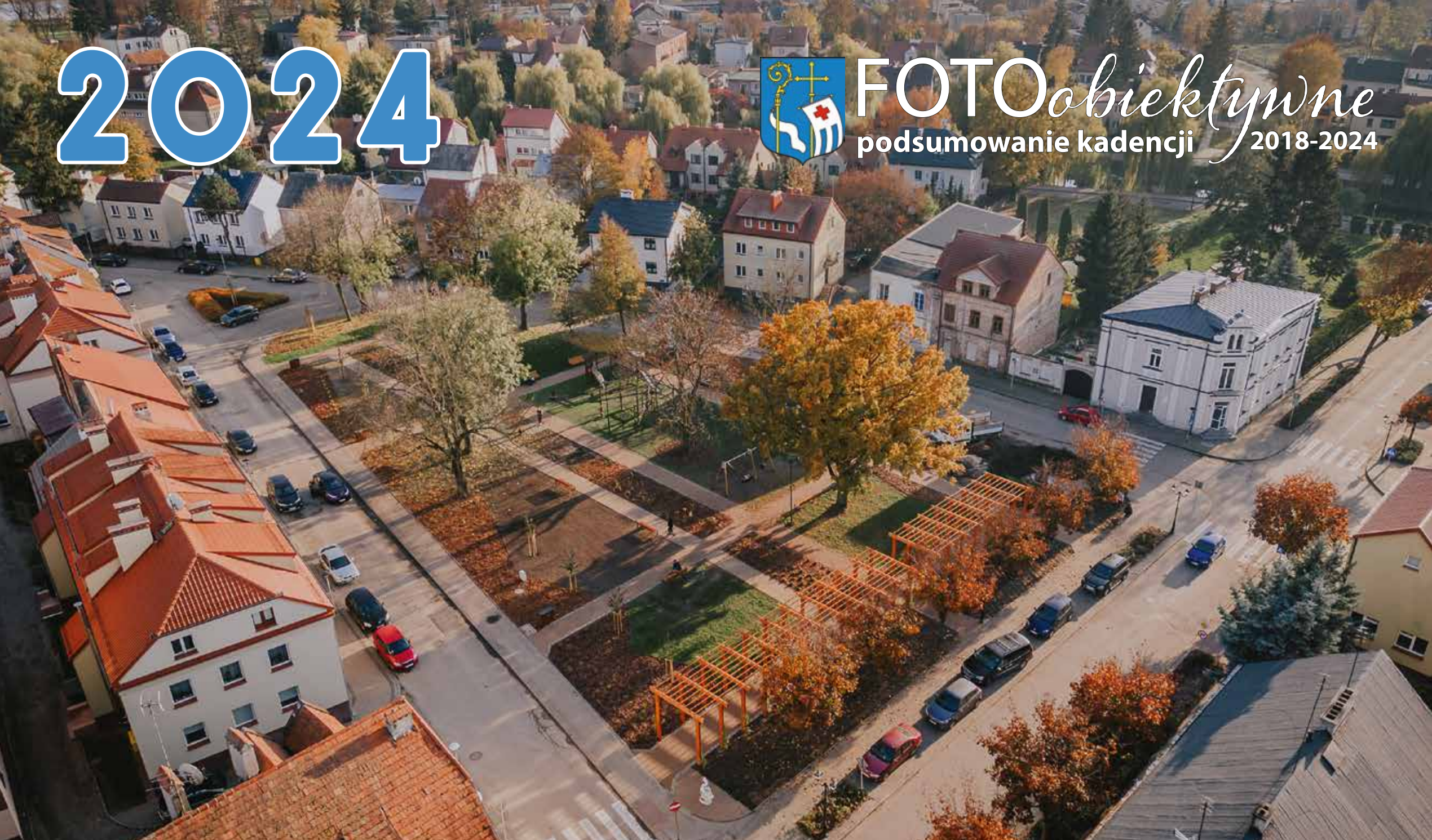
Plac Marszałka Józefa Piłsudskiego

FOTO Obiektywne podsumowanie kadencji 2018-2024