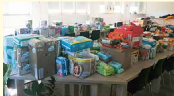
Artykuły zebrane dla osób potrzebujących pomocy