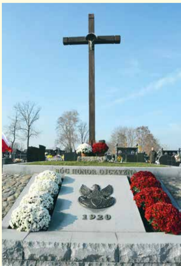
Odnowiona mogiła żołnierzy polskich poległych w 1920 r.