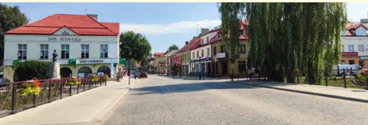
Przebudowany most i ulica Świętojańska