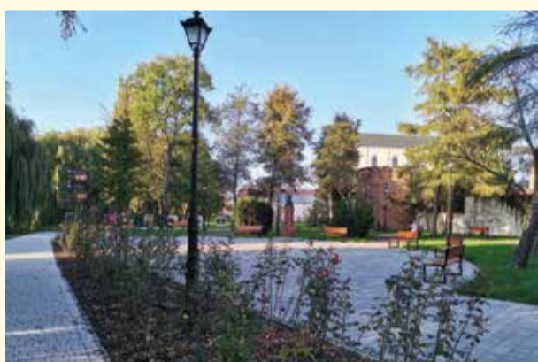
Aleja Wiktora Gomulickiego