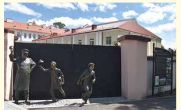
Rzeźba grupowa przy LO im. Piotra Skargi przedstawiająca scenkę ze „Wspomnień niebieskiego mundurka” W. Gomułickiego