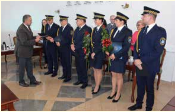
30-lecie Straży Miejskiej w Pułtusku