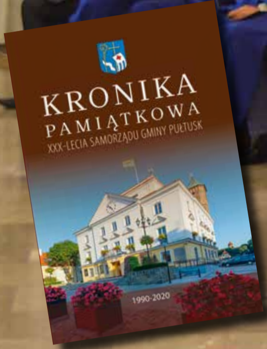
Uroczysta Sesja Rady Miejskiej w Pułtusku, Kronika pamiątkowa XXX-lecia Samorządu Gminy Pułtusk

FOTOobiektywne podsumowanie kadencji 2018-2024