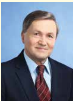
Stanisław Zaremba Przewodniczący Komisji Polityki Społecznej