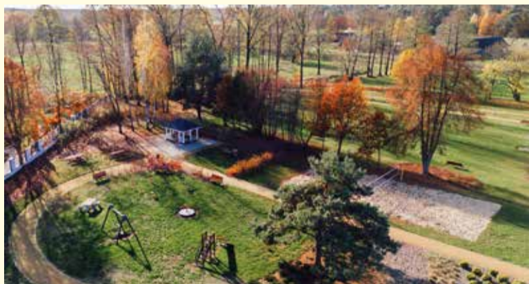
Park przy Świętlicy Wiejskiej w Grabówcu