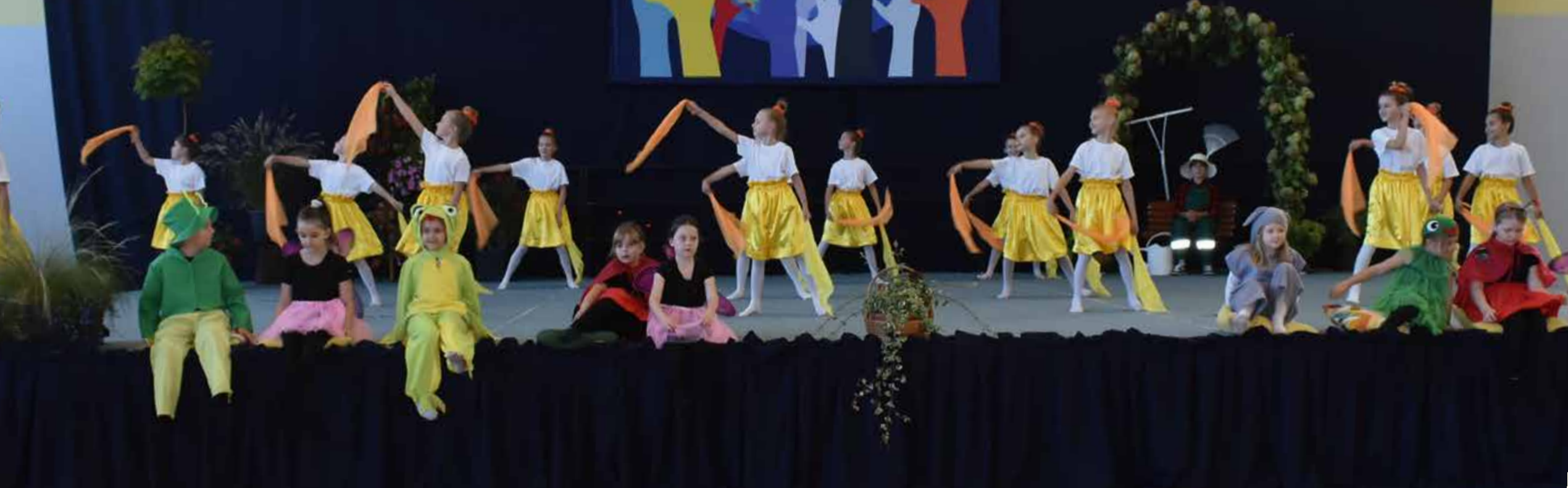
Piknik ekologiczny w ZS nr 2