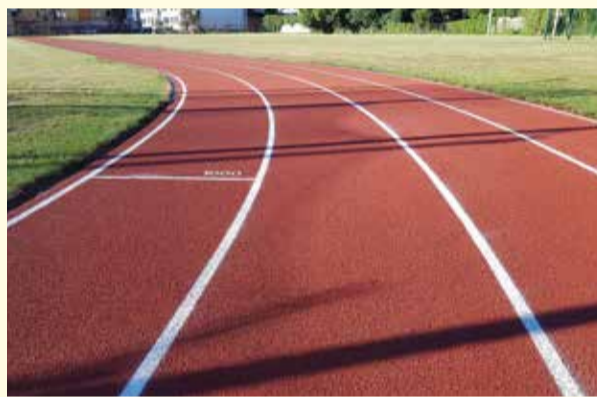
Bieżnia lekkoatletyczna przy PSP nr 4