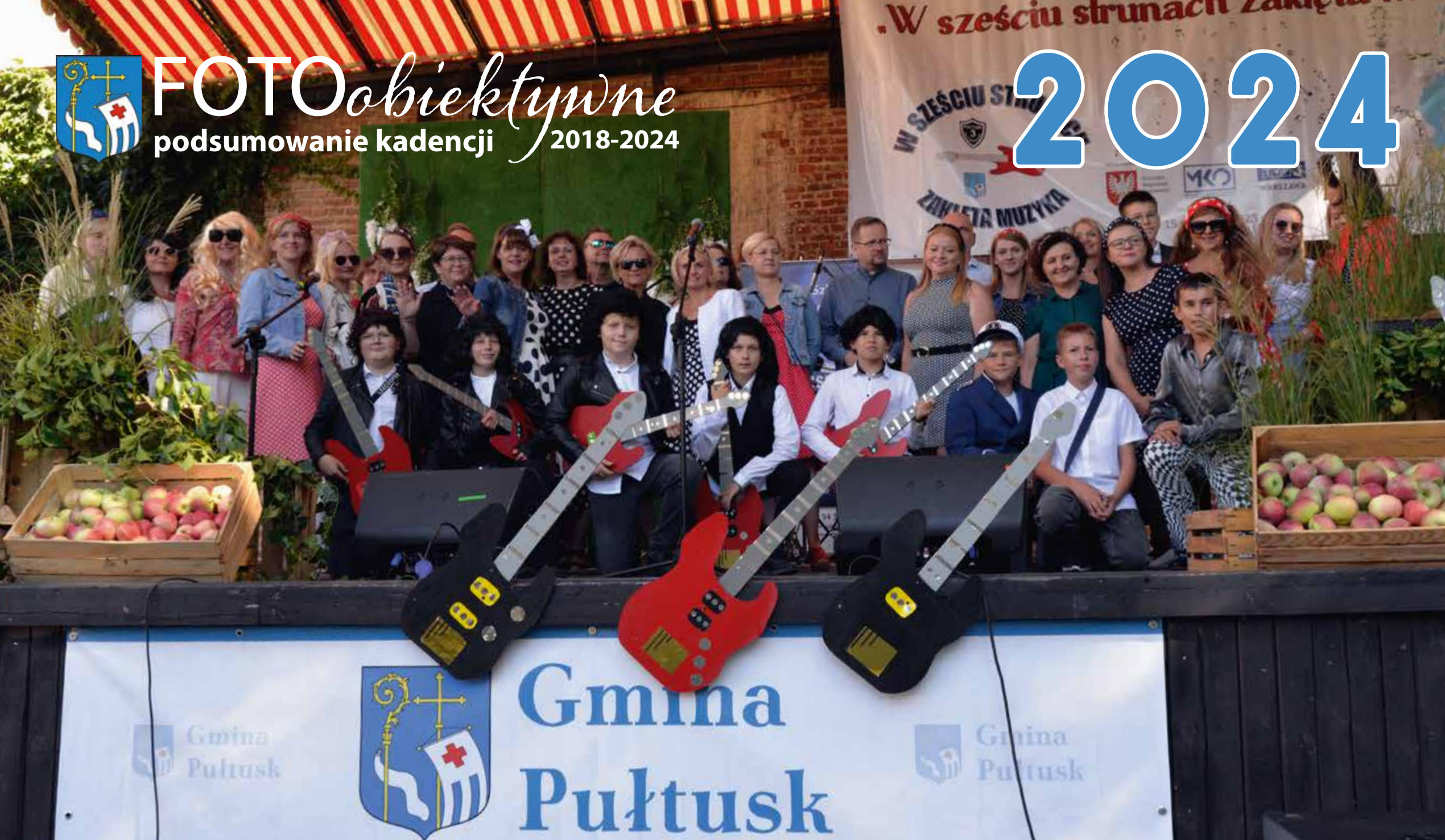
Ogólnopolski Konkurs Piosenek Polskich Wykonawców lat 60. i 70. XX w. „W sześciu strunach zaklęta muzyka”