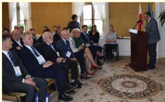
Forum Polsko-Ukraińskie promujące pułtuskie podmioty gospodarcze