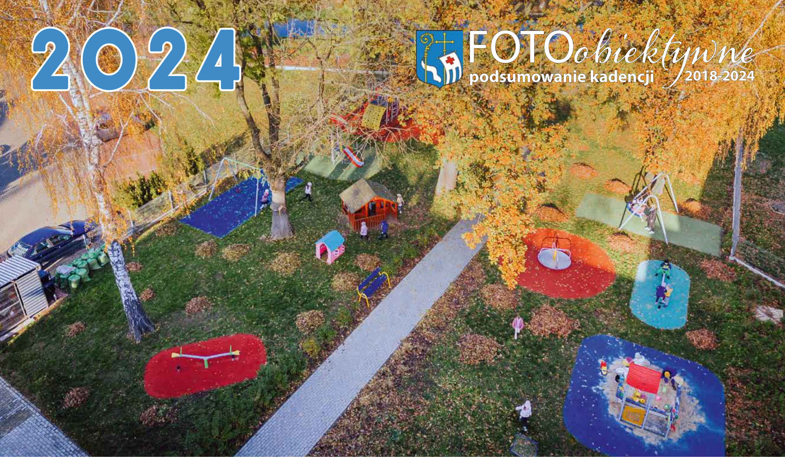
Plac zabaw PM nr 4 przy ul. M. Konopnickiej

FOTOobiektywne podsumowanie kadencji 2018-2024