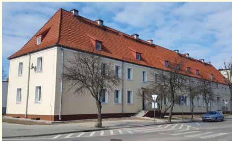
Budynek przy ul. 17 Sierpnia 58 po termomodernizacji