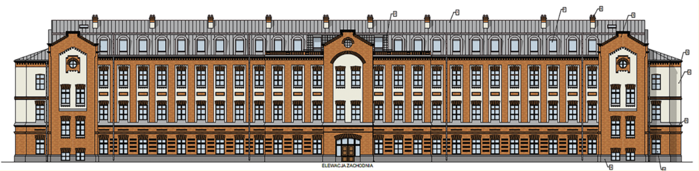
Projekt budynku mieszkalnego przy al. Tysiąclecia 2A

FOTOobiektywne podsumowanie kadencji 2018-2024