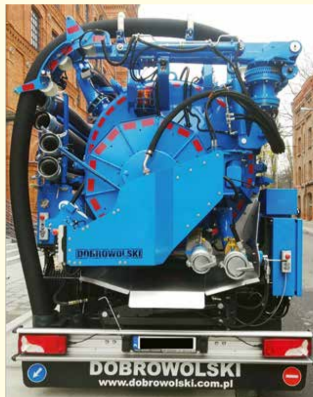
Pojazd specjalistyczny (samochód ciśnieniowo-ssący) do obsługi i konserwacji sieci kanalizacji sanitarnej