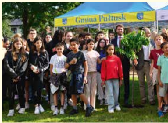
Posadzenie wiśni Montmorency na pl. Marszałka Józefa Piłsudskiego