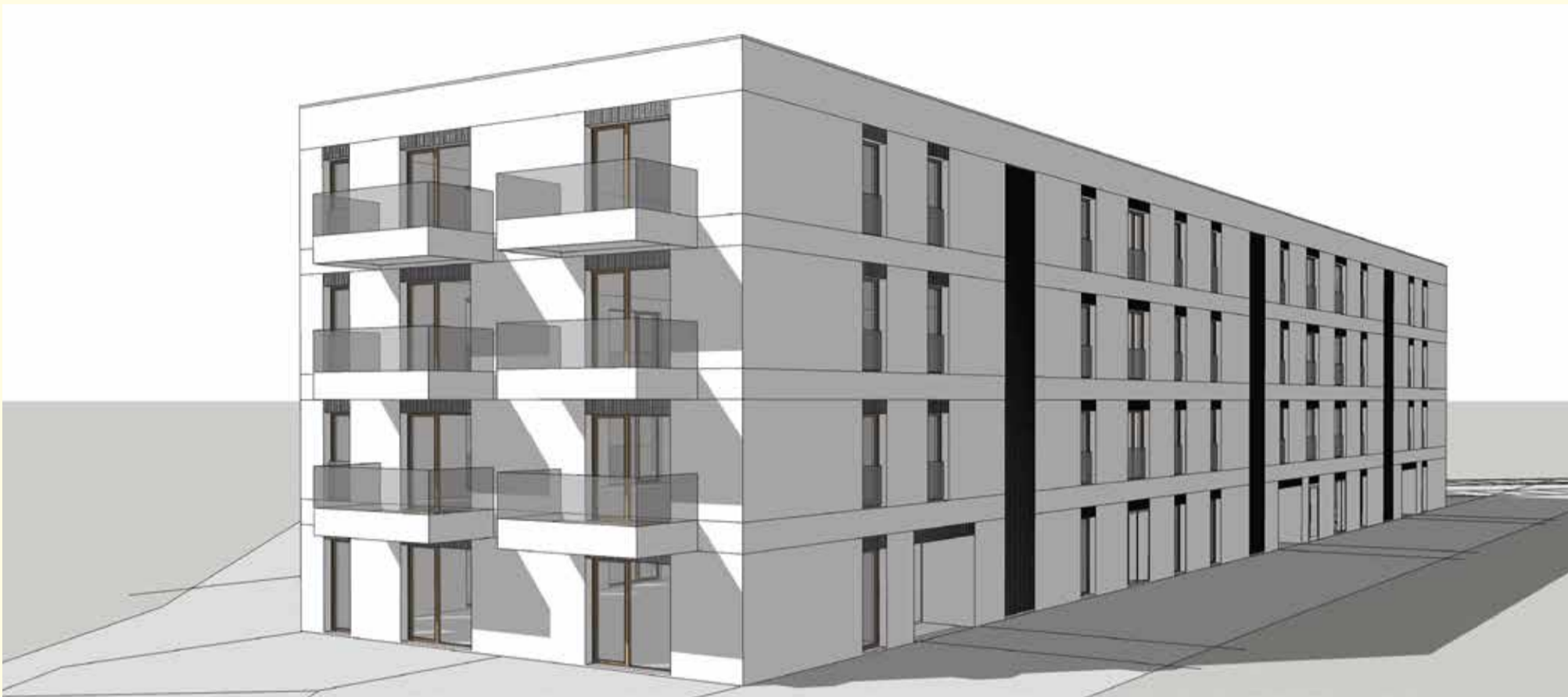
Projekt budynku mieszkalnego przy ul. Teofila Kwiatkowskiego