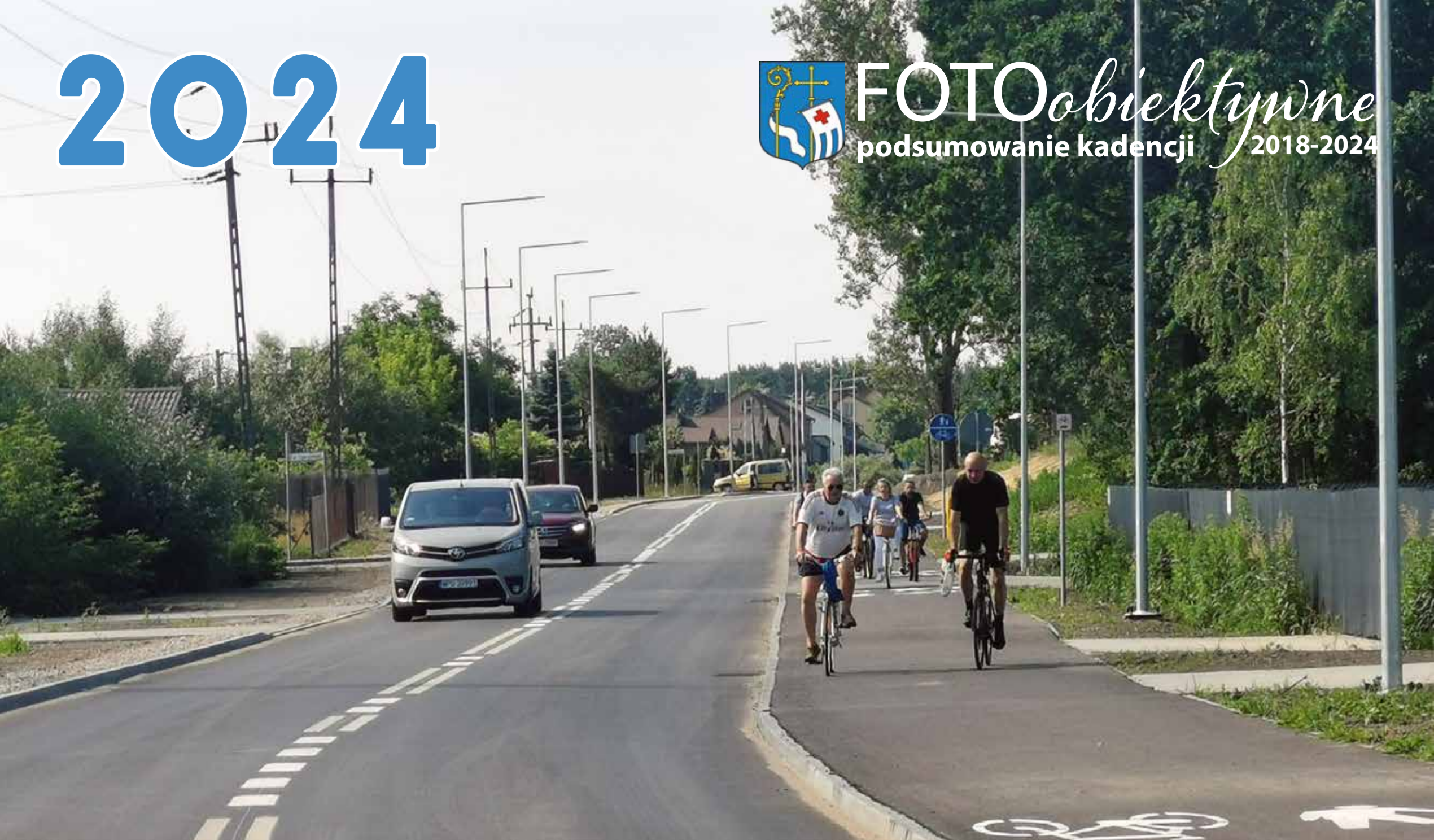
Rozbudowa ul. Granicznej wraz z ciągiem pieszo-rowerowym i infrastrukturą rowerową

FOTOobiektywne podsumowanie kadencji 2018-2024