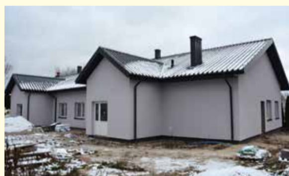
Świetlica Wiejska w Płocochowie