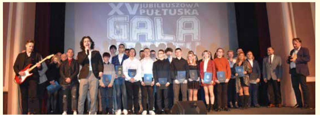
Gala Sportu - stypendiści i zwycięzcy