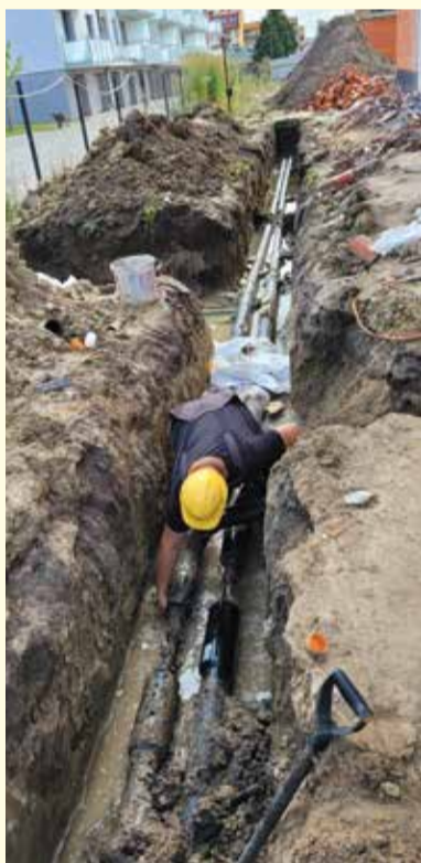
Budowa przyłącza ciepłowniczego do budynku wielorodzinnego przy ul. Mickiewicza