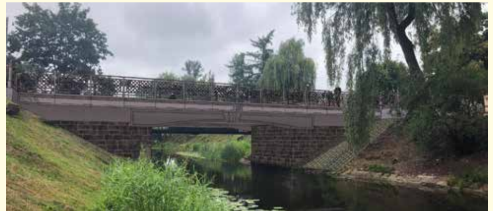
Wizualizacja przebudowy mostu Benedyktynskiego