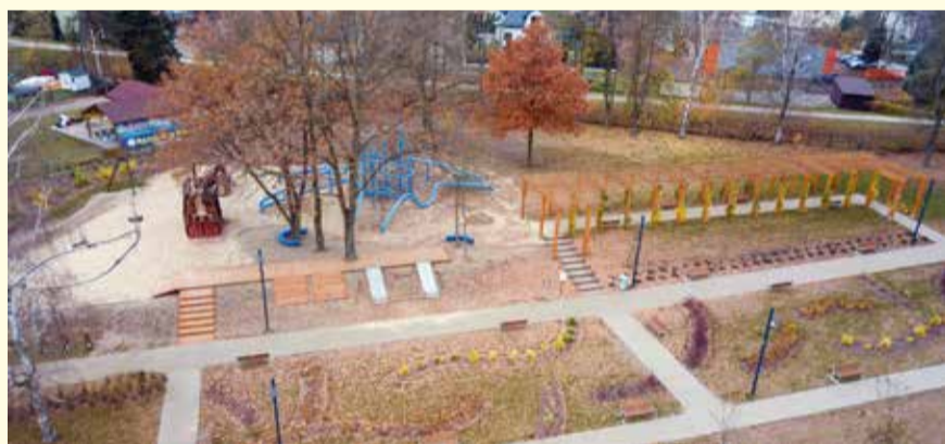
Przystań Miejska z placem wodnym