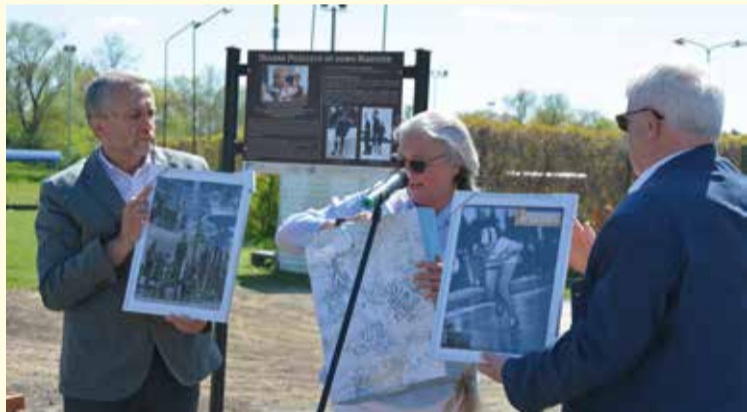
Ulica Heleny Pilejczyk, czyli „mała obwodnica” Puktuska