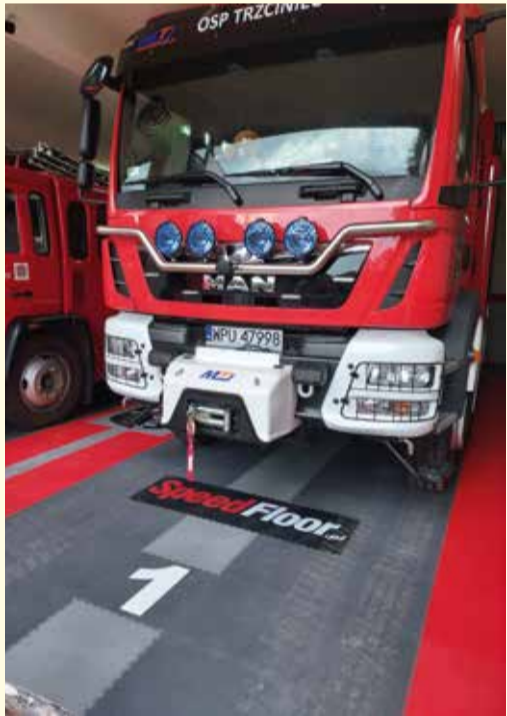
Wóz bojowy OSP Trzciniec zakupiony przy wsparciu finansowym Gminy Pułtusk