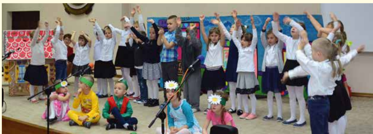
Jubileusz 40-lecia PM nr 5