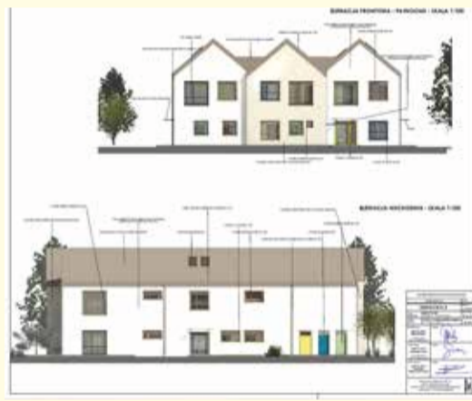
Projekt PM nr 3 z oddziałem żłobkowym