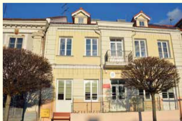
Centrum Dziedzictwa Kulturowego w Pułtusku