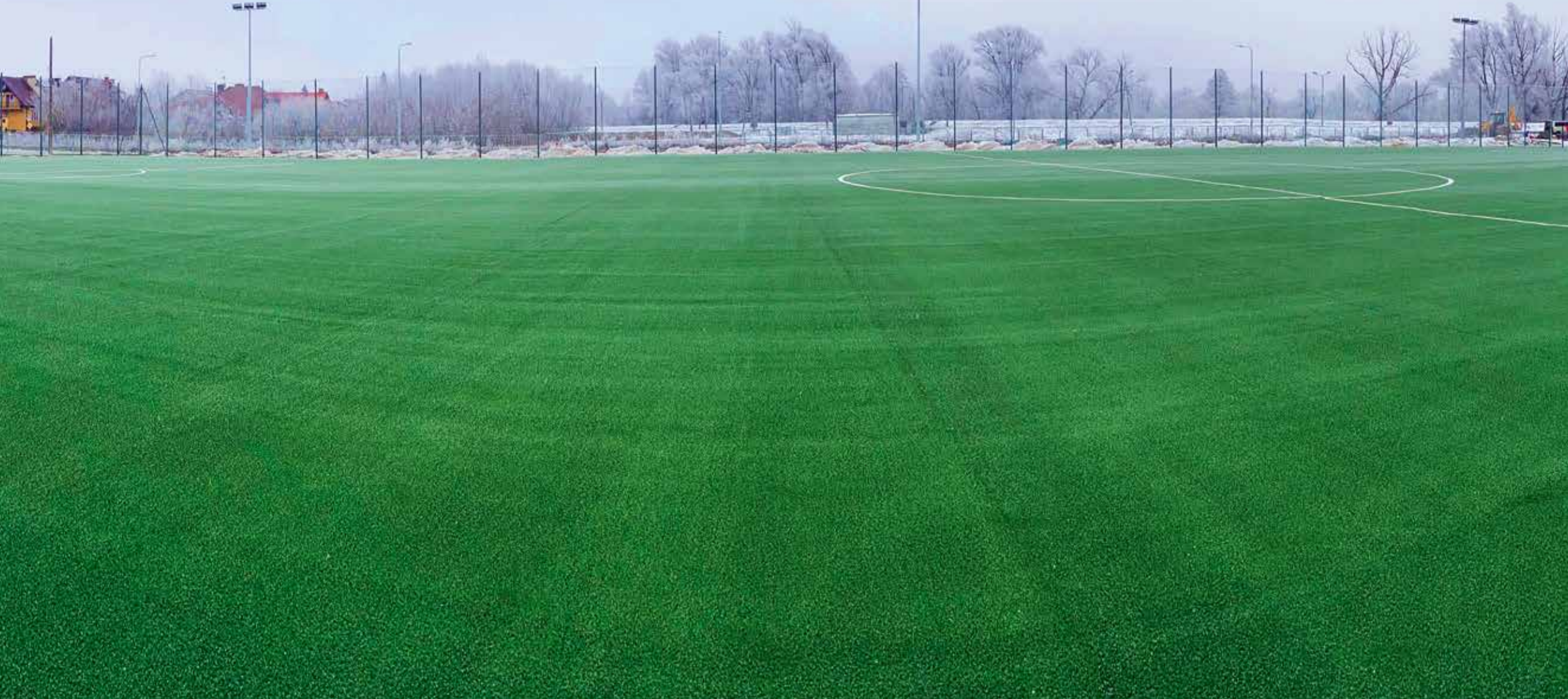
Przebudowa kompleksu rekreacyjno-sportowego MOSiR w Pułtusku

FOTOobiektywne podsumowanie kadencji 2018-2024