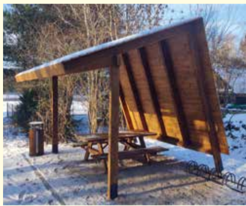
Miejsce odpoczynku rowerzystów