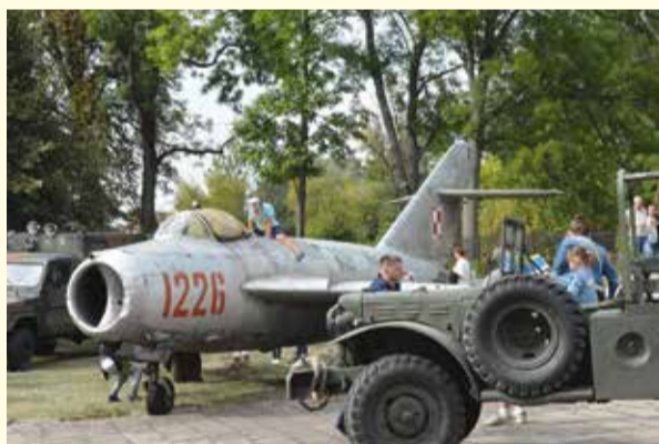
Piknik Military w ramach obchodów 80. rocznicy wybuchu II wojny światowej