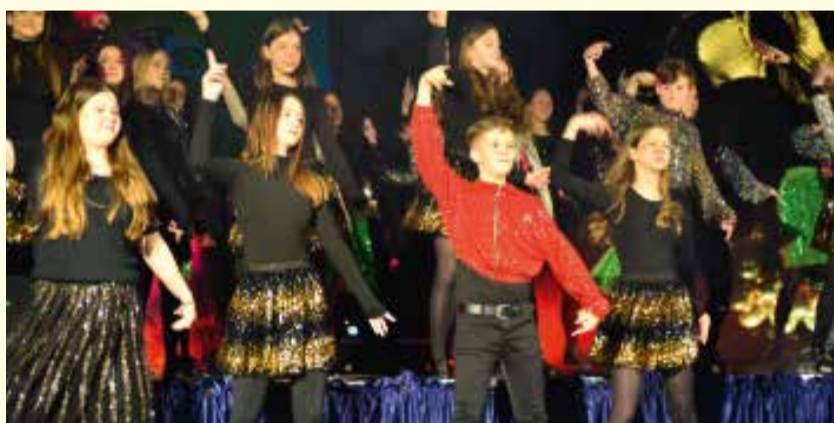
Jubileuszowa XV Gala Talentów w PSP nr 4