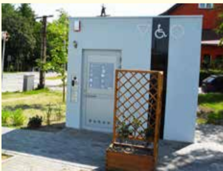
Jedna z trzech automatycznych toalet miejskich