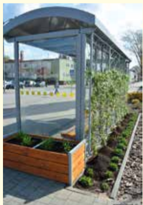
Zielona wiata przystankowa