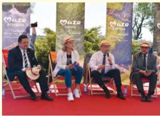
Otwarcie sezonu turystycznego na Mazowszu