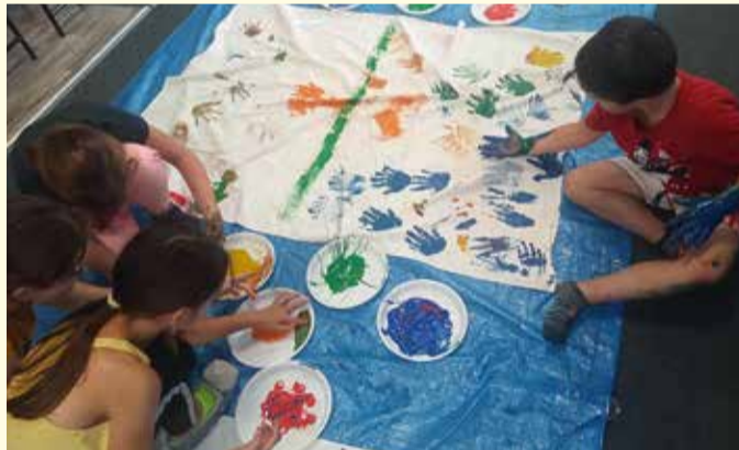
Warsztaty letnie w Świetlicy „Słonecznikowa Brać”