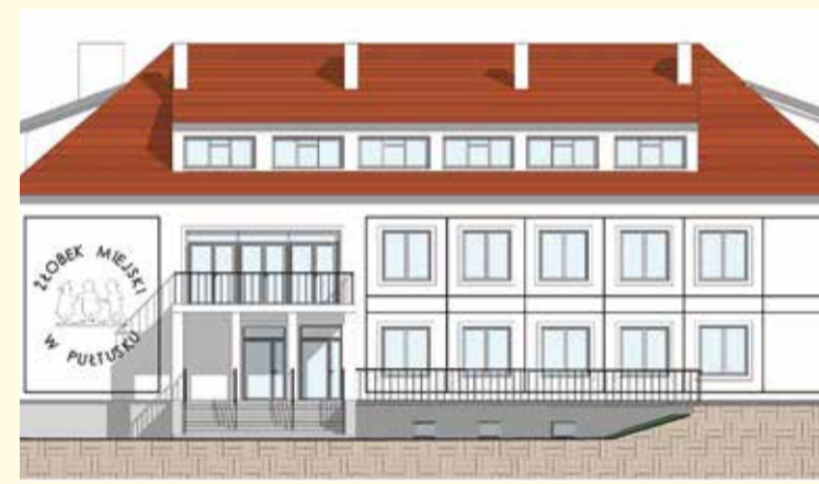
Projekt Żłobka Miejskiego przy ul. Staszica