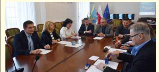
Przekazanie sprzętu i oprogramowania komputerowego, zakupionego w ramach Programu „Cyfrowa Gmina”