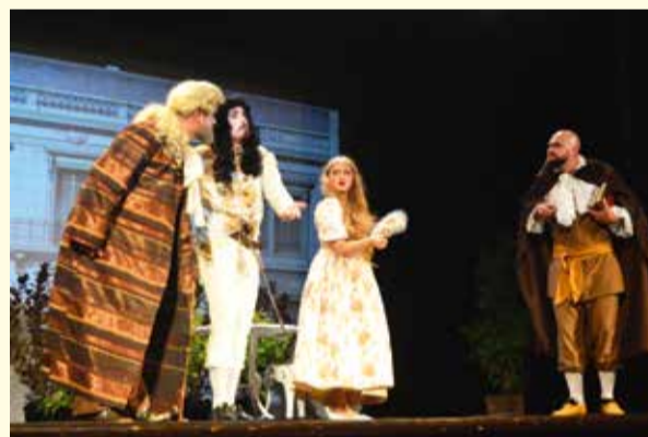
Spektakl w ramach Pułtuskich Teatrów Amatorskich – Konkursu „PTAK”