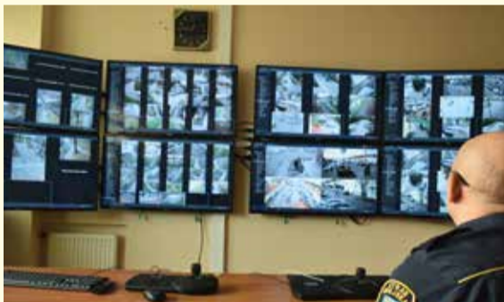
Rozbudowany system monitoringu miejskiego