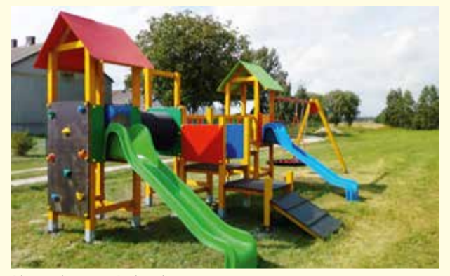
Plac zabaw w Bobach