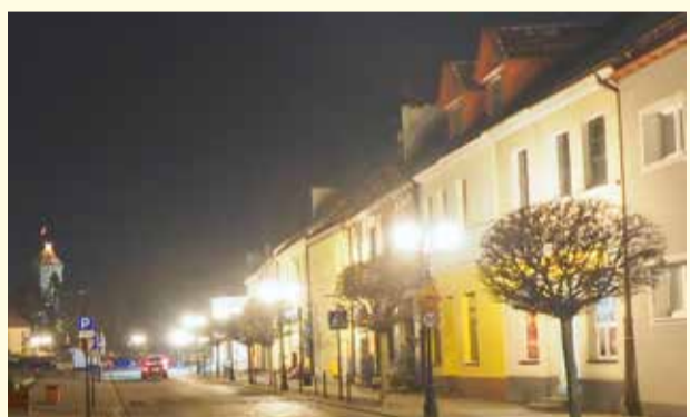
Wymienione oświetlenie przy ul. Rynek