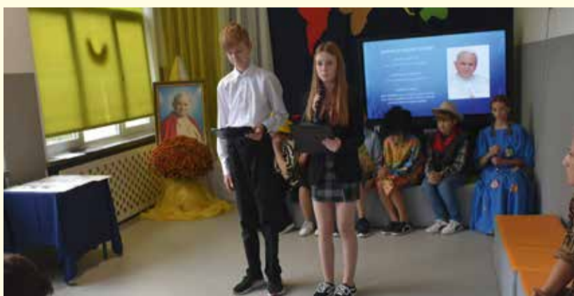
Gminny Konkurs Papieski organizowany przez PSP im. bł. Jana II w Płocochowie