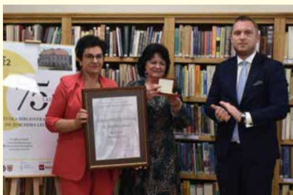
Jubileusz 75-lecia Pułtuskiej Biblioteki Publicznej im. J. Lelewela