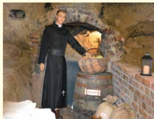
Piwnice pojezuickie pod Wzgórzem Abrahama