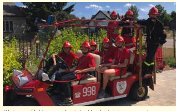
Obóz profilaktyczny dla dzieci i młodzieży, zorganizowany przy wsparciu finansowym z funduszy Gminnego Programu Profilaktyki i Rozwiązywania Problemów Alkoholowych oraz Przeciwdziałania Narkomanii