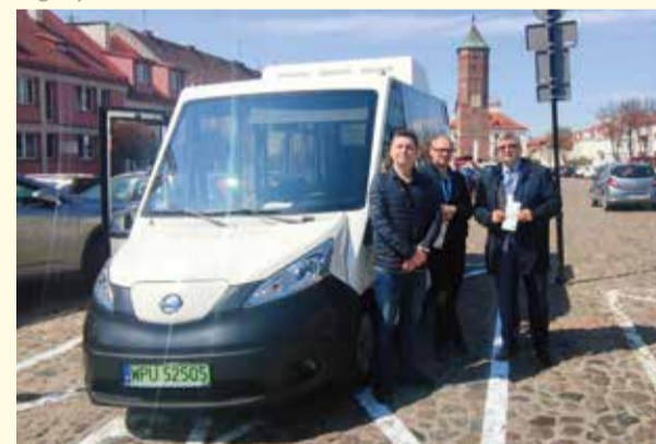
Nowy produkt turystyczny – przejazdy eko-busem z przewodnikiem