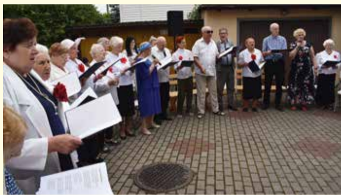
Występ uczestników Dziennego Domu „Senior+”