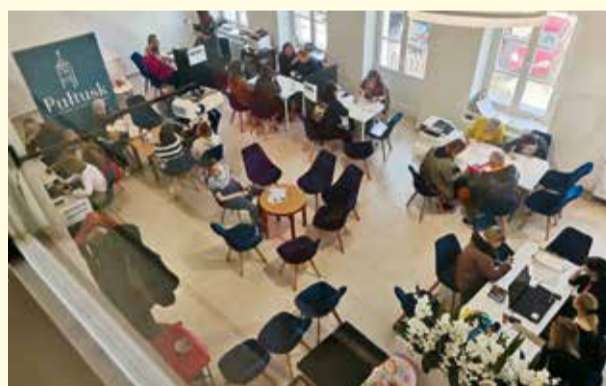
Punkt Informacyjny o pomocy uchodźcom z Ukrainy w Centrum Dziedzictwa Kulturowego