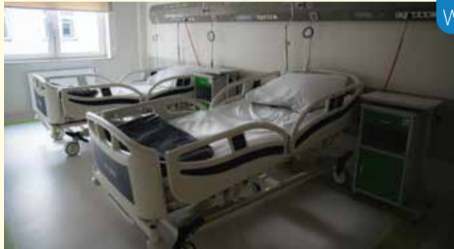
Dwa z dziesięciu łóżek zakupionych ze środków własnych Gminy w celu zapewnienia opieki medycznej chorym na Covid-19