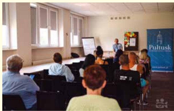
Cykl spotkań profilaktycznych „Rodzinne poniedziałki” w pułtuskim MOPS