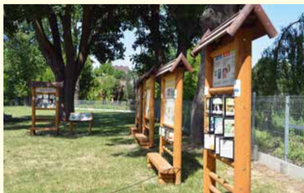
Ścieżka edukacyjna przy PSP nr 1