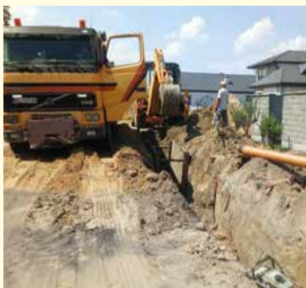
Budowa kanalizacji sanitarnej w ul. Burmistrza Stanisława Śniegockiego