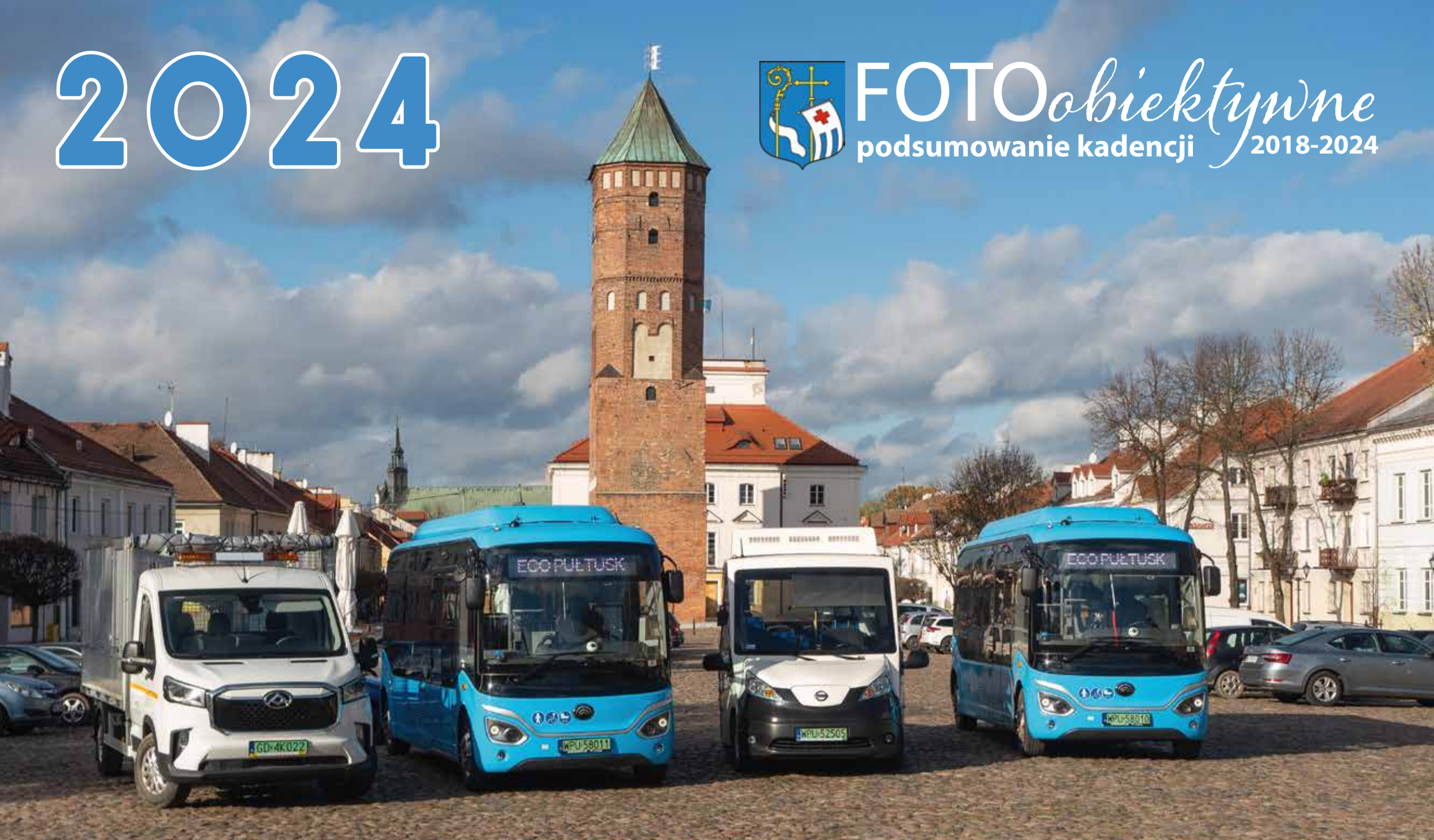
Nowa flota PPUK – elektryczne autobusy, pojazd elektro-solarny i pojazd do zbiórki odpadów „siatkowiec”

FOTOobiektywne podsumowanie kadencji 2018-2024