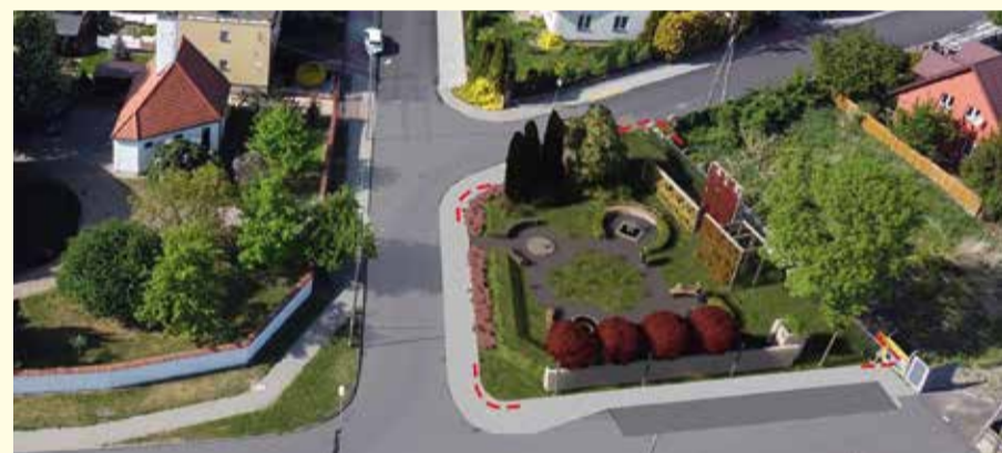
Wizualizacja skweru archeologów