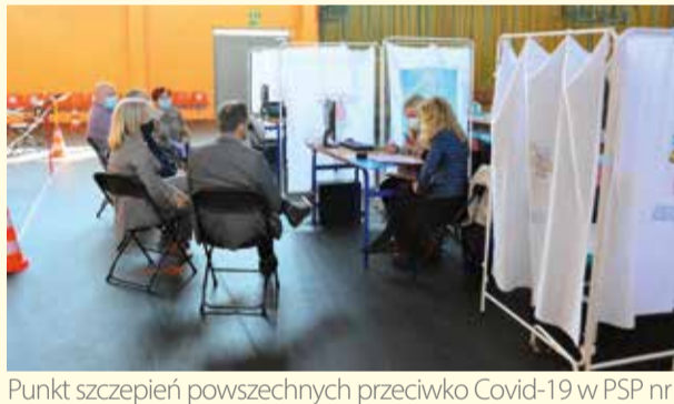
Punkt szczepień powszechnych przeciwko Covid-19 w PSP nr 3